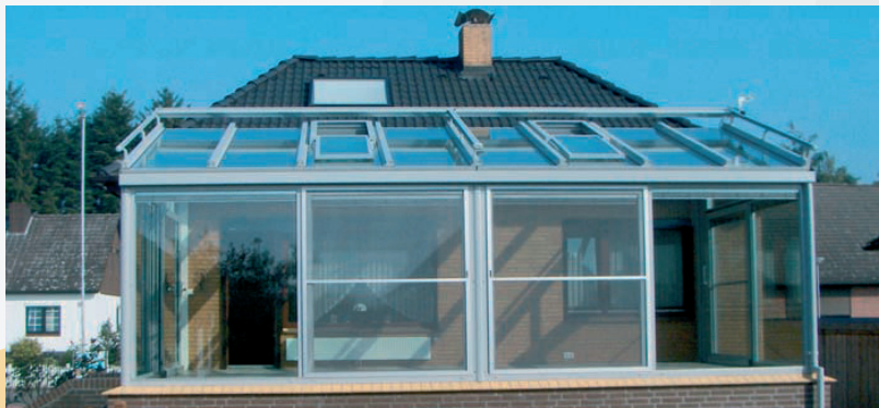
Niet alleen de zijwanden kunnen in dit voorbeeld worden geopend, maar ook kunnen de schuifdakramen automatisch worden geopend.

Het automatische schuifdakraam is met één (SWSD-10), twee (SWSD-20) of drie (SWSD-30) schuivende delen te verkrijgen. Het raam kan zowel in een veranda- als in een serredak eenvoudig worden ingebouwd. Bijzonder is dat het raam ook ingebouwd kan worden in een traditioneel dak.